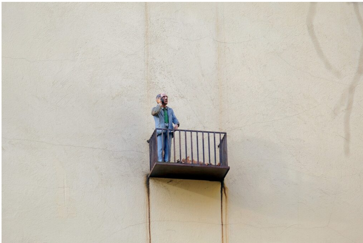
Podwórko przy ul Traugutta 10. „Sąsiedzi”. Autor – Isaak Cordal