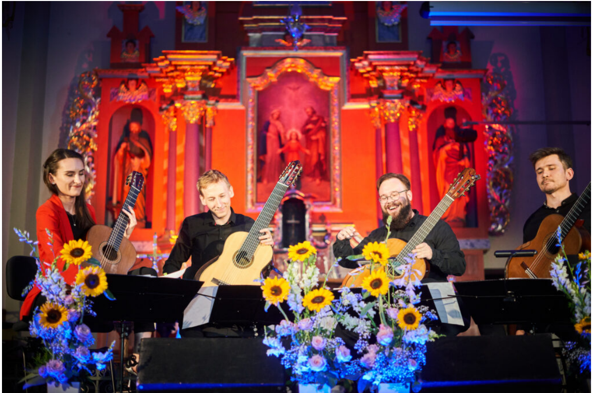
2 lipca 2022, Koncert w Bełdowie