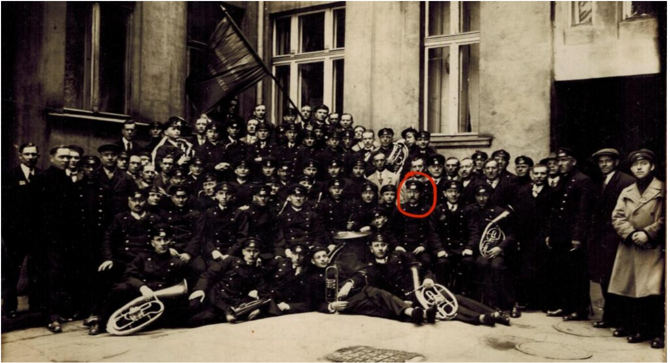
Orkiestra Łódzkich Tramwajarzy