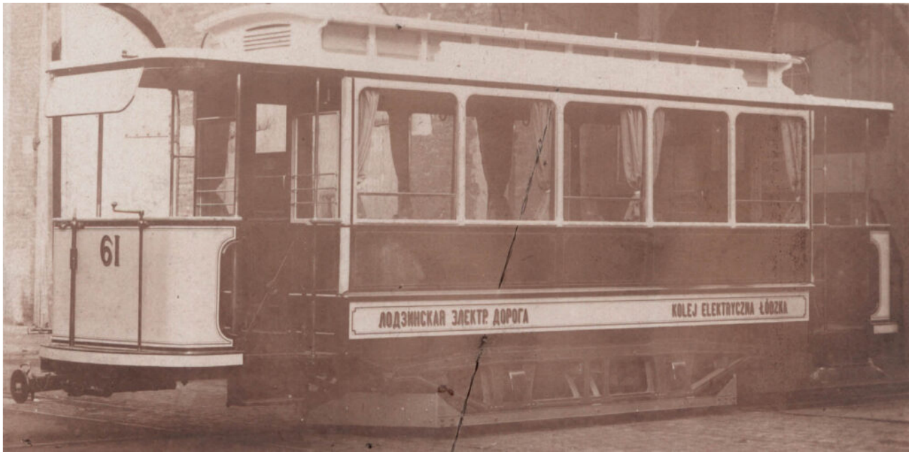
Wagon silnikowy Herbrandt na ulicach Łodzi, ok. 1920 r.