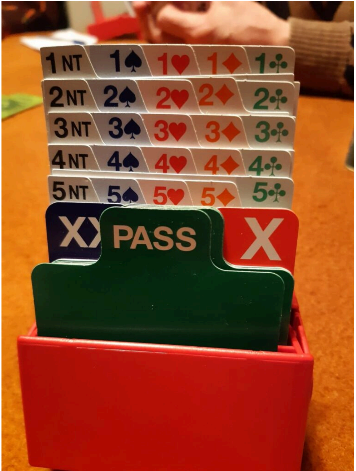
▪ kasetka licytacyjna