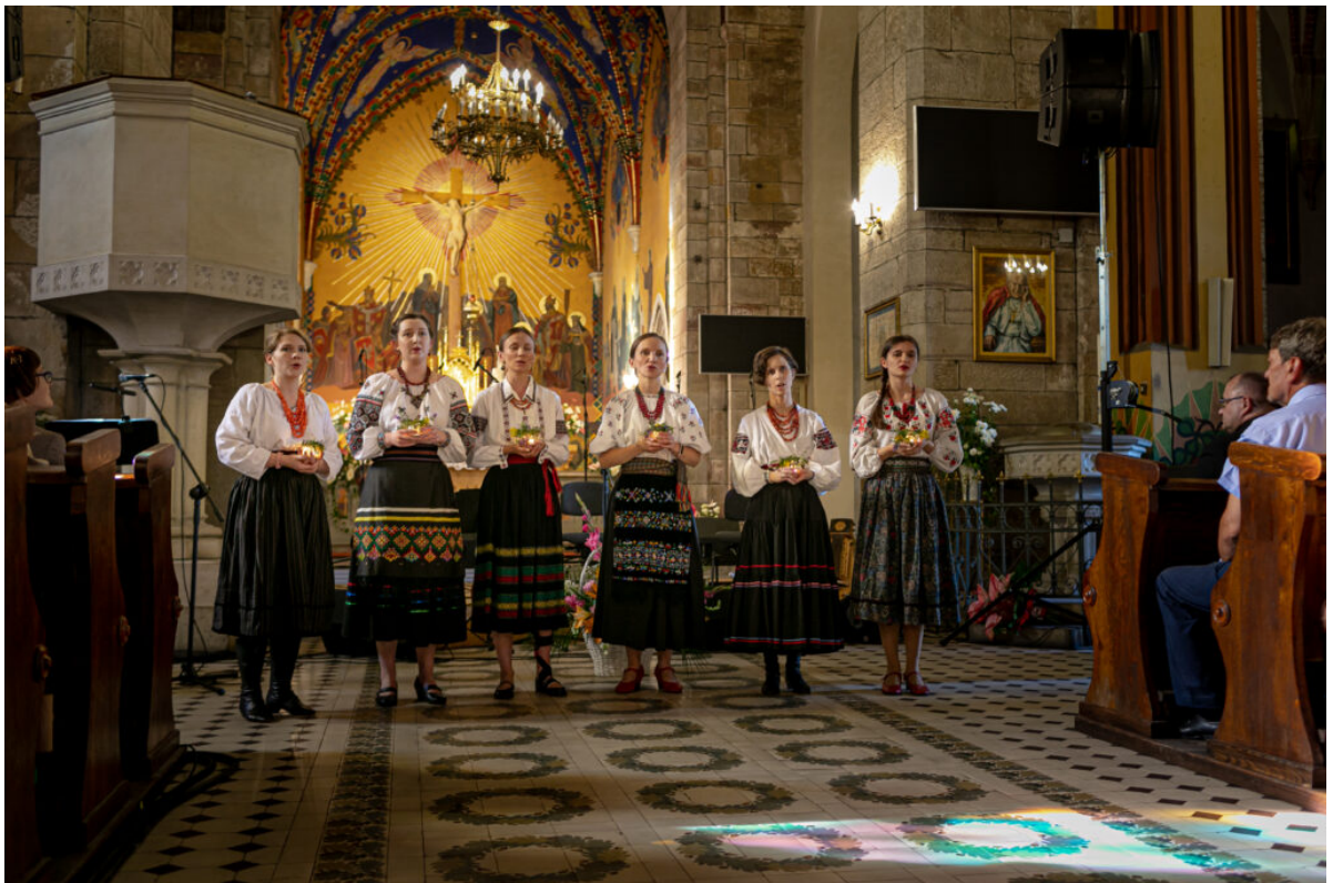
3 lipca 2022, koncert w Żarnowie.