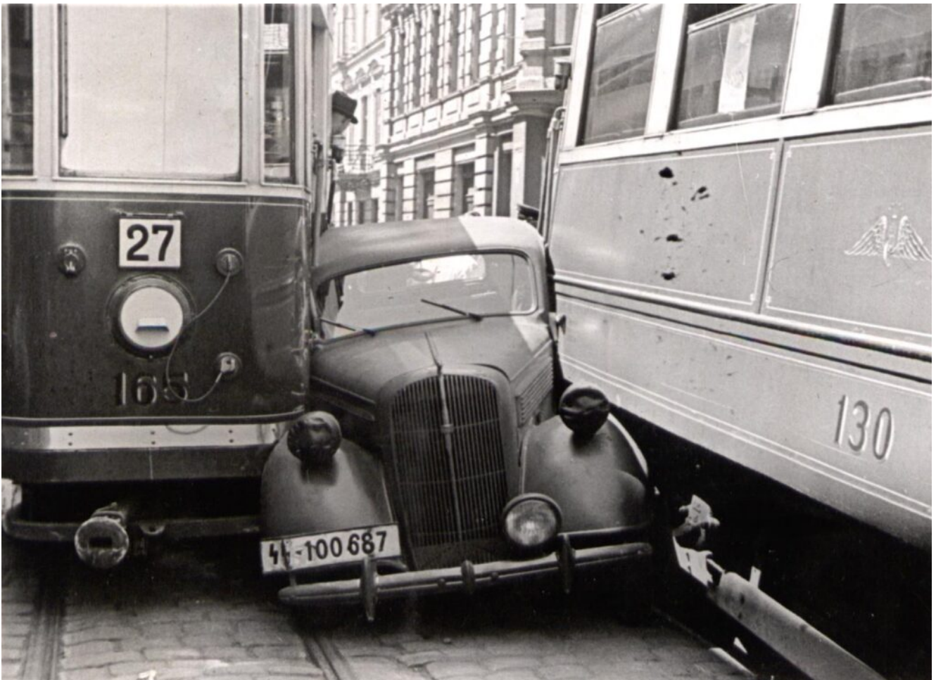
Zderzenie tramwajów z autem na ulicy Narutowicza. Okres okupacji SS.