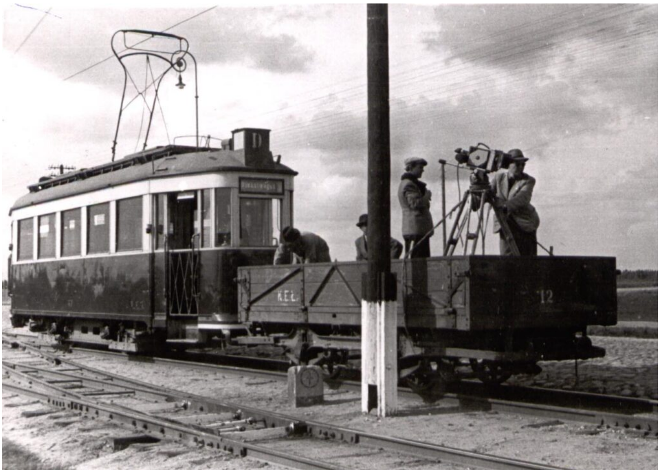
Ekipa filmowa na platformie tramwajowej. Okres okupacji SS.