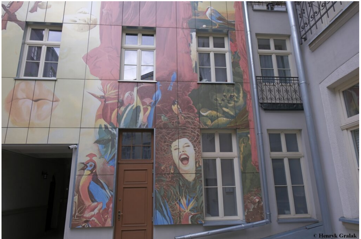
Podwórko przy u. Więckowskiego 4. Autor – Wojciech Siudmak