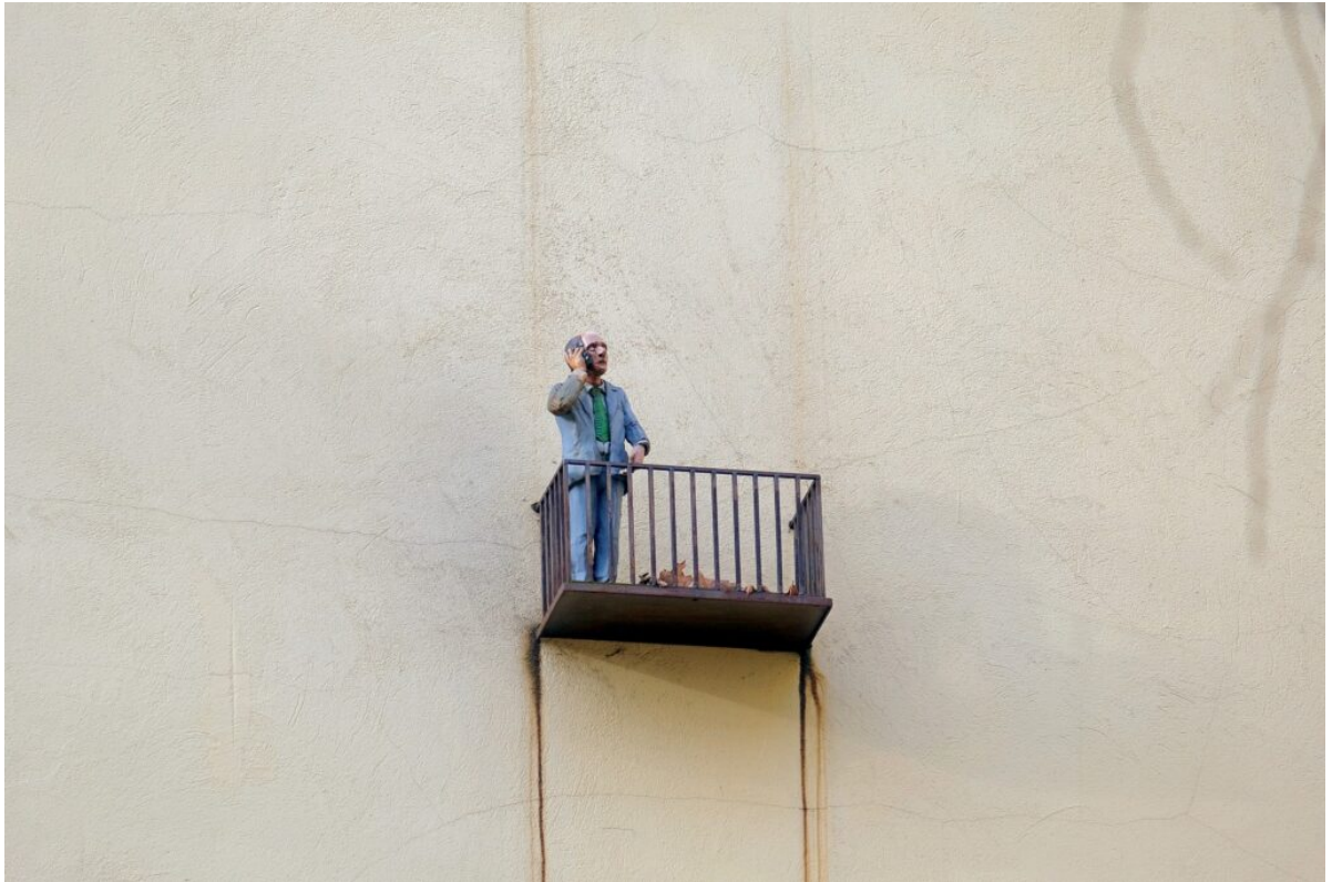
■ Podwórko przy ul Traugutta 10. „Sąsiedzi”. Autor – Isaak Cordal