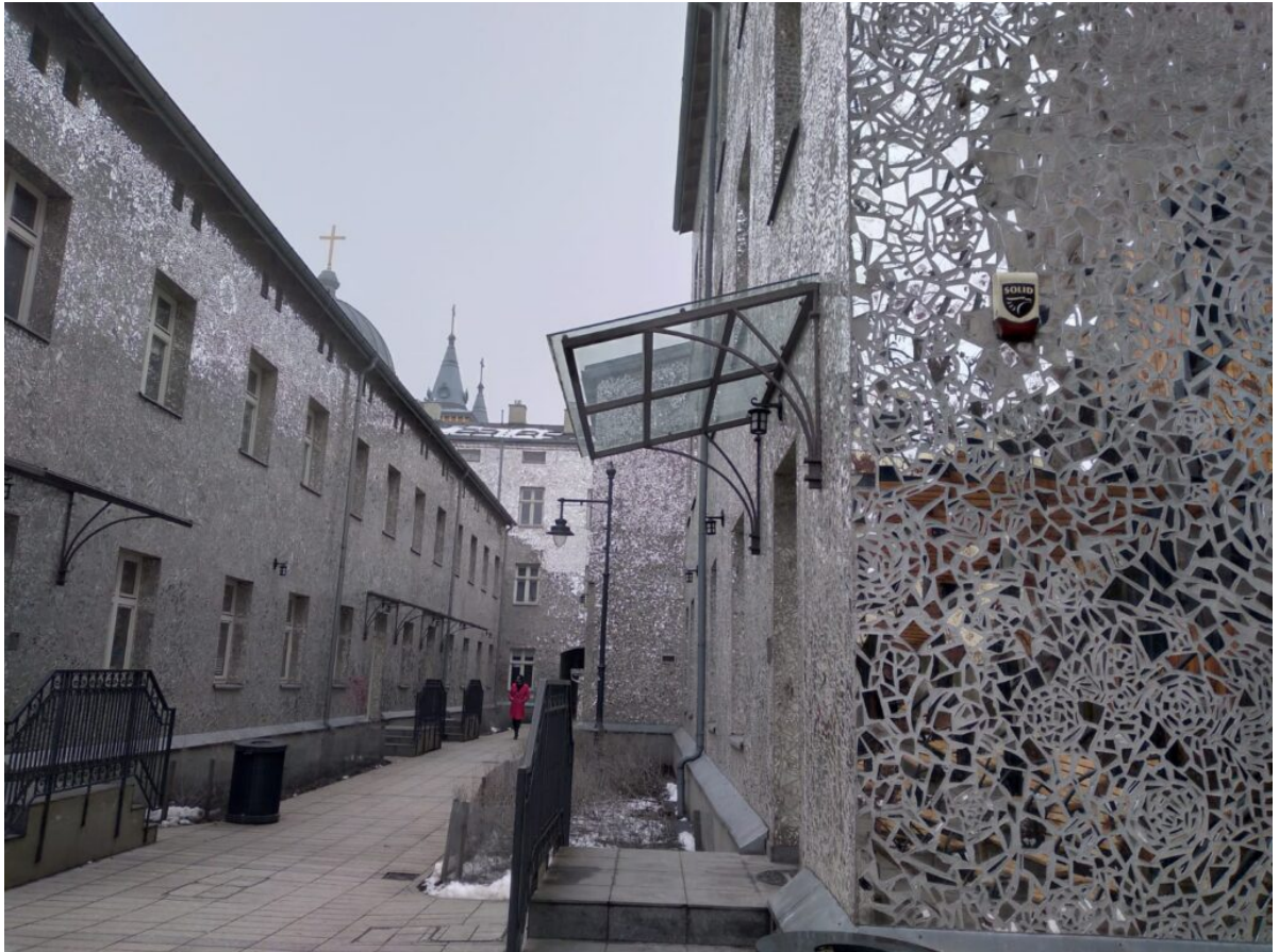
Podwórze przy ul. Piotrkowskiej 3. „Pasaż Róży”. Autorka – Joanna Rajkowska.