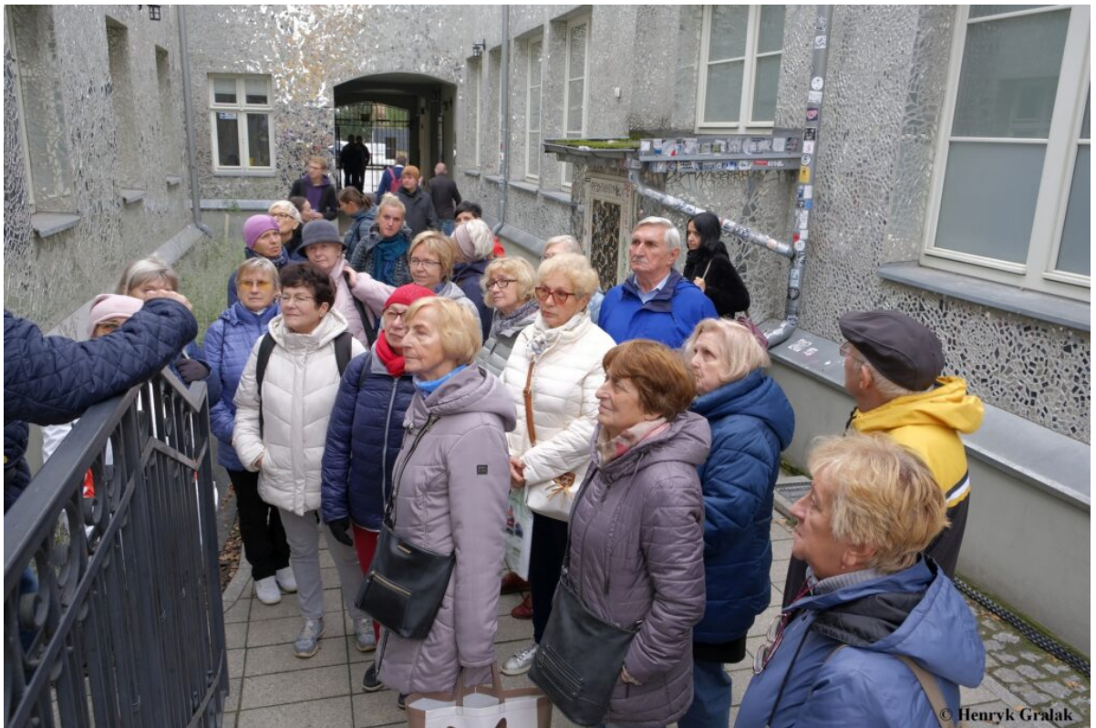
Podwórze przy ul. Piotrkowskiej 3. „Pasaż Róży”. Autorka – Joanna Rajkowska.