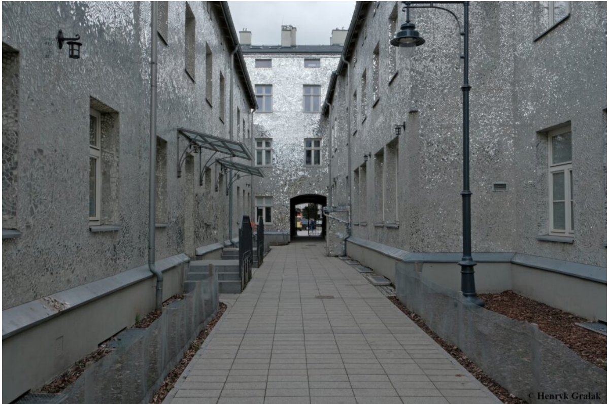
Podwórko przy ul. Piotrkowskiej 3. „Pasaż Róży”. Autorka – Joanna Rajkowska.