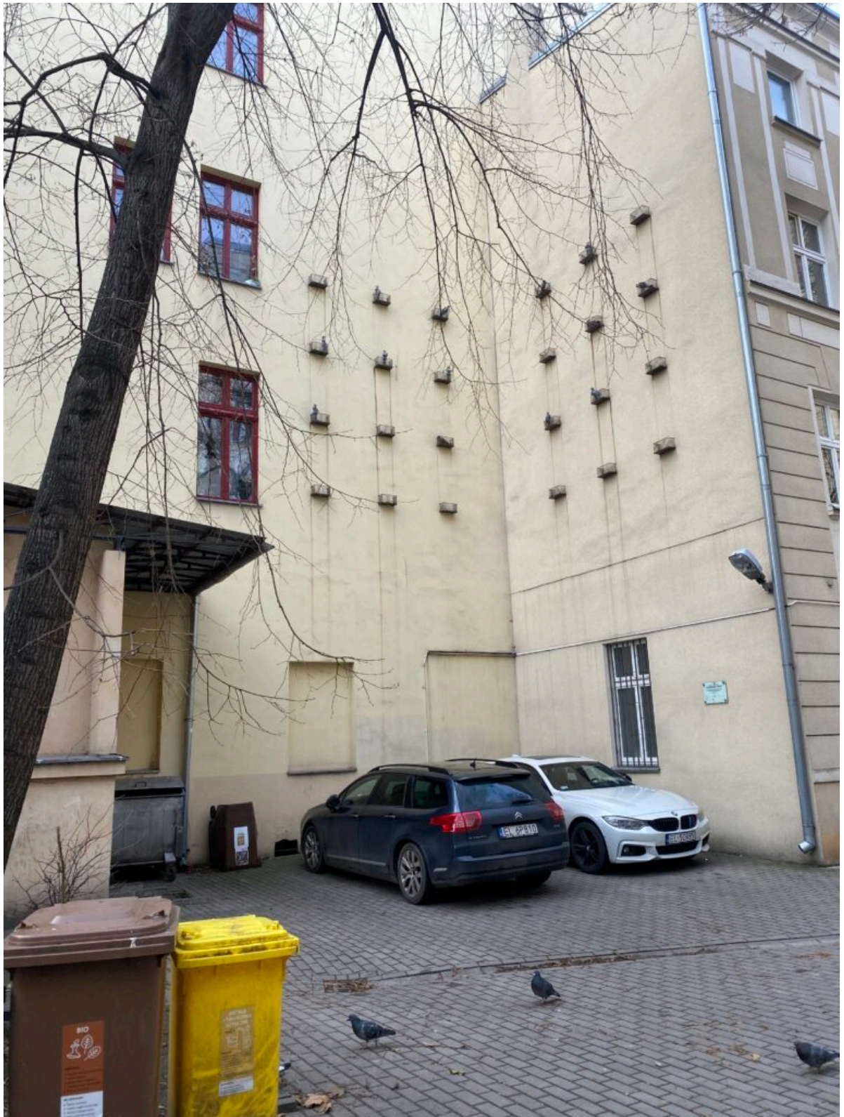
Podwórko przy ul Traugutta 10. „Sąsiedzi”. Autor – Isaak Cordal