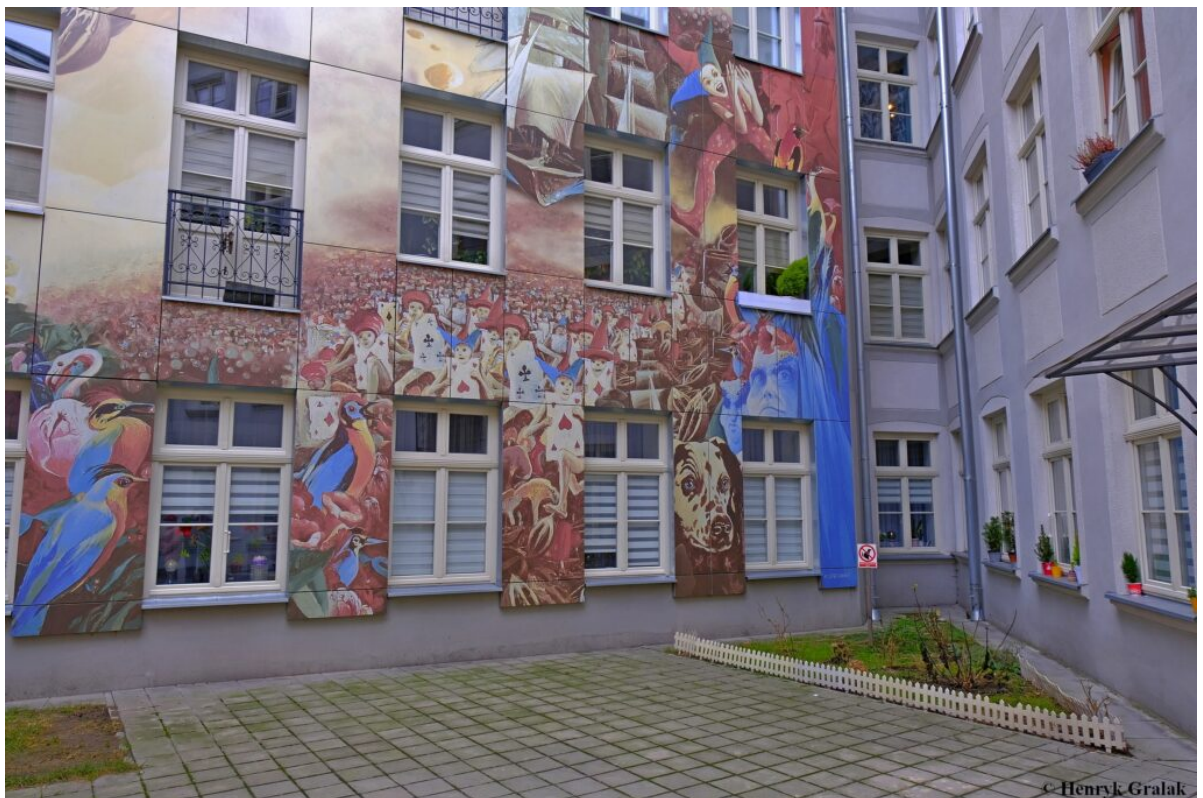
Podwórko przy u. Więckowskiego 4. Autor – Wojciech Siudmak