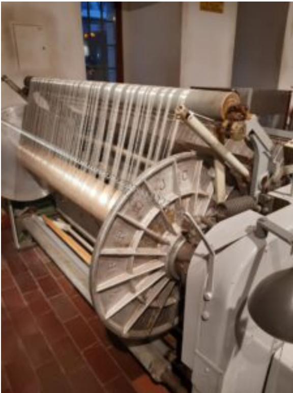
Centralne Muzeum Włókiennictwa w Łodzi