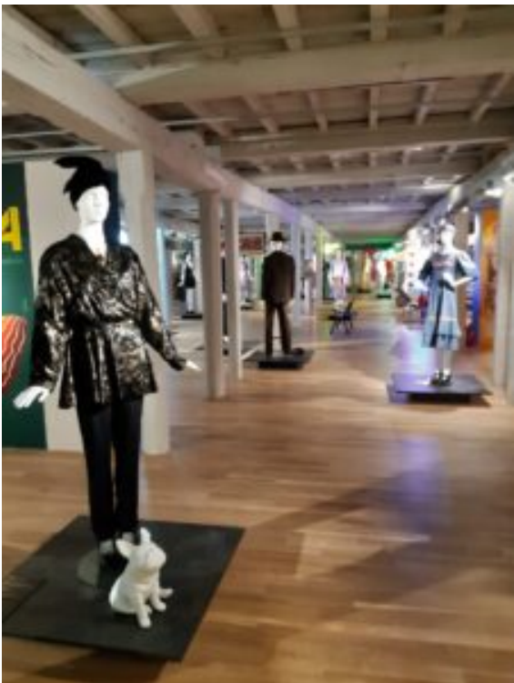
Centralne Muzeum Włókiennictwa w Łodzi