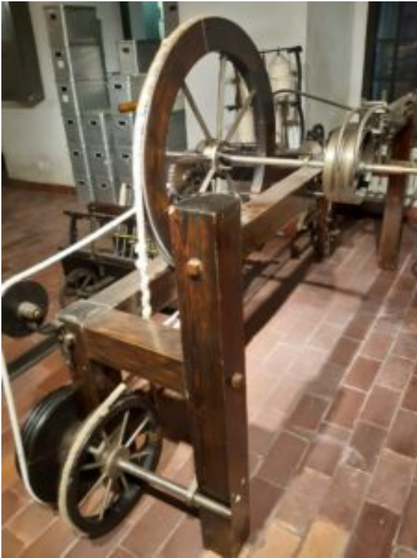
Centralne Muzeum Włókiennictwa w Łodzi