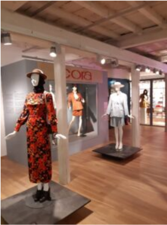
Centralne Muzeum Włókiennictwa w Łodzi