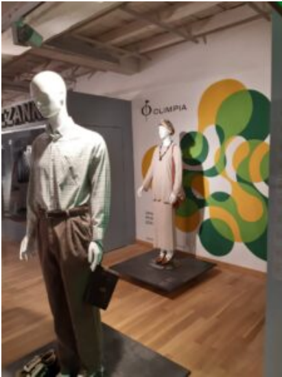
Centralne Muzeum Włókiennictwa w Łodzi