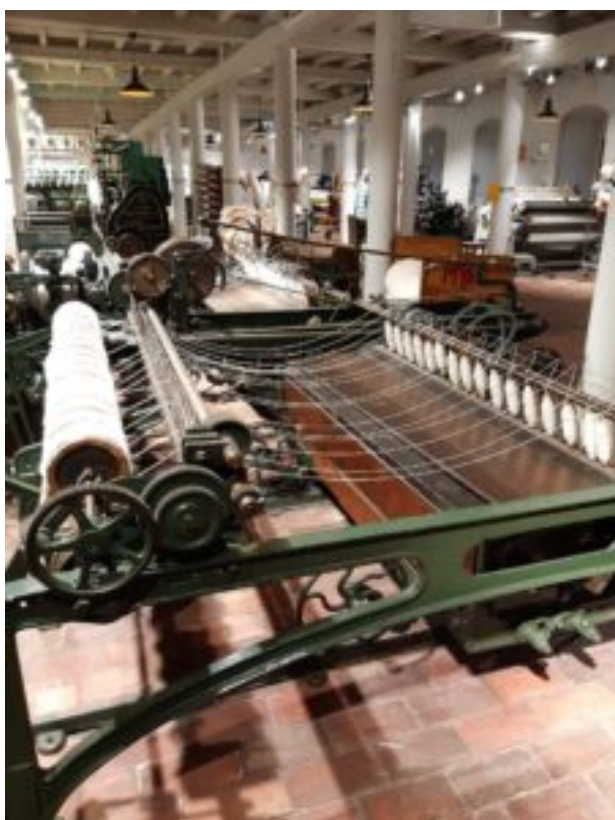
Centralne Muzeum Włókiennictwa w Łodzi

https://plasterlodzki.pl/miasto-maszyna-moda-w-centralnym-muzeum-wlokiennictwa/