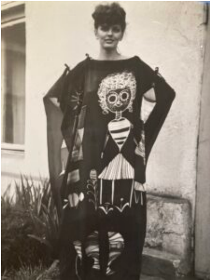
Projekt sukienki autorstwa Magdy Druri (1980)