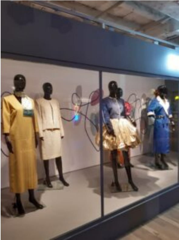
Centralne Muzeum Włókiennictwa w Łodzi