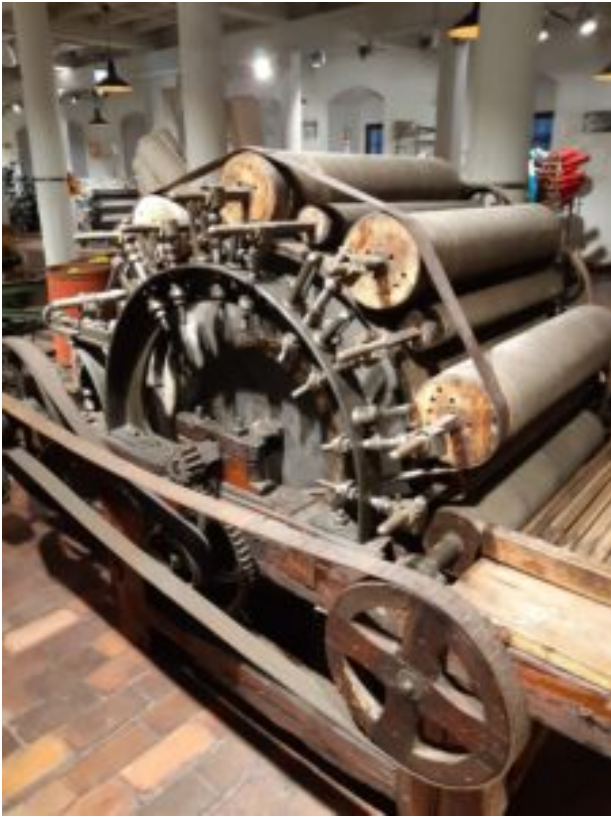
Centralne Muzeum Włókiennictwa w Łodzi