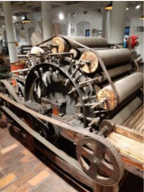
Centralne Muzeum Włókiennictwa w Łodzi