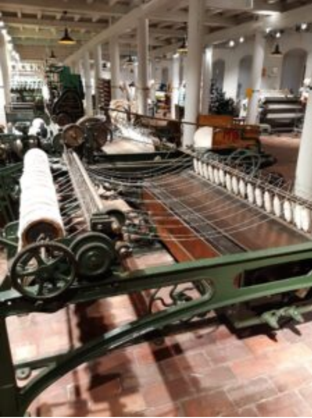
Centralne Muzeum Włókiennictwa w Łodzi