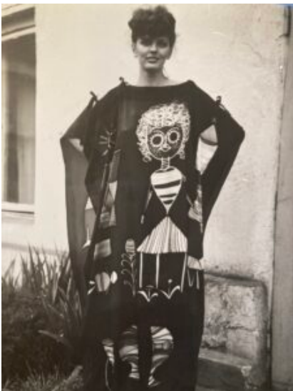
Projekt sukienki autorstwa Magdy Druri (1980)