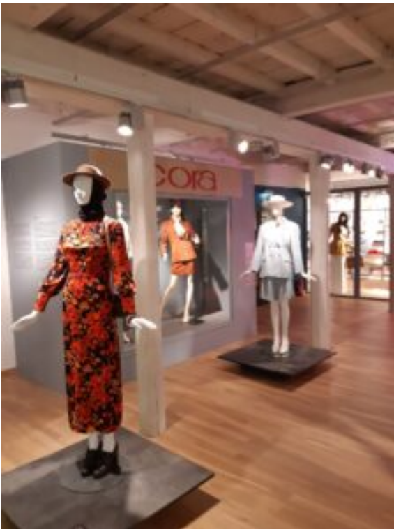
Centralne Muzeum Włókiennictwa w Łodzi