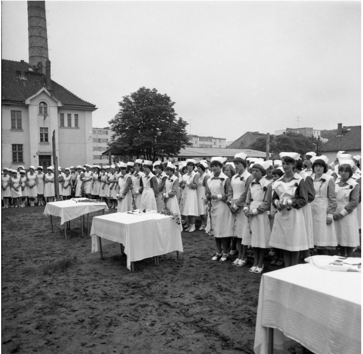
■ Czepkowanie w Liceum Medycznym 1977