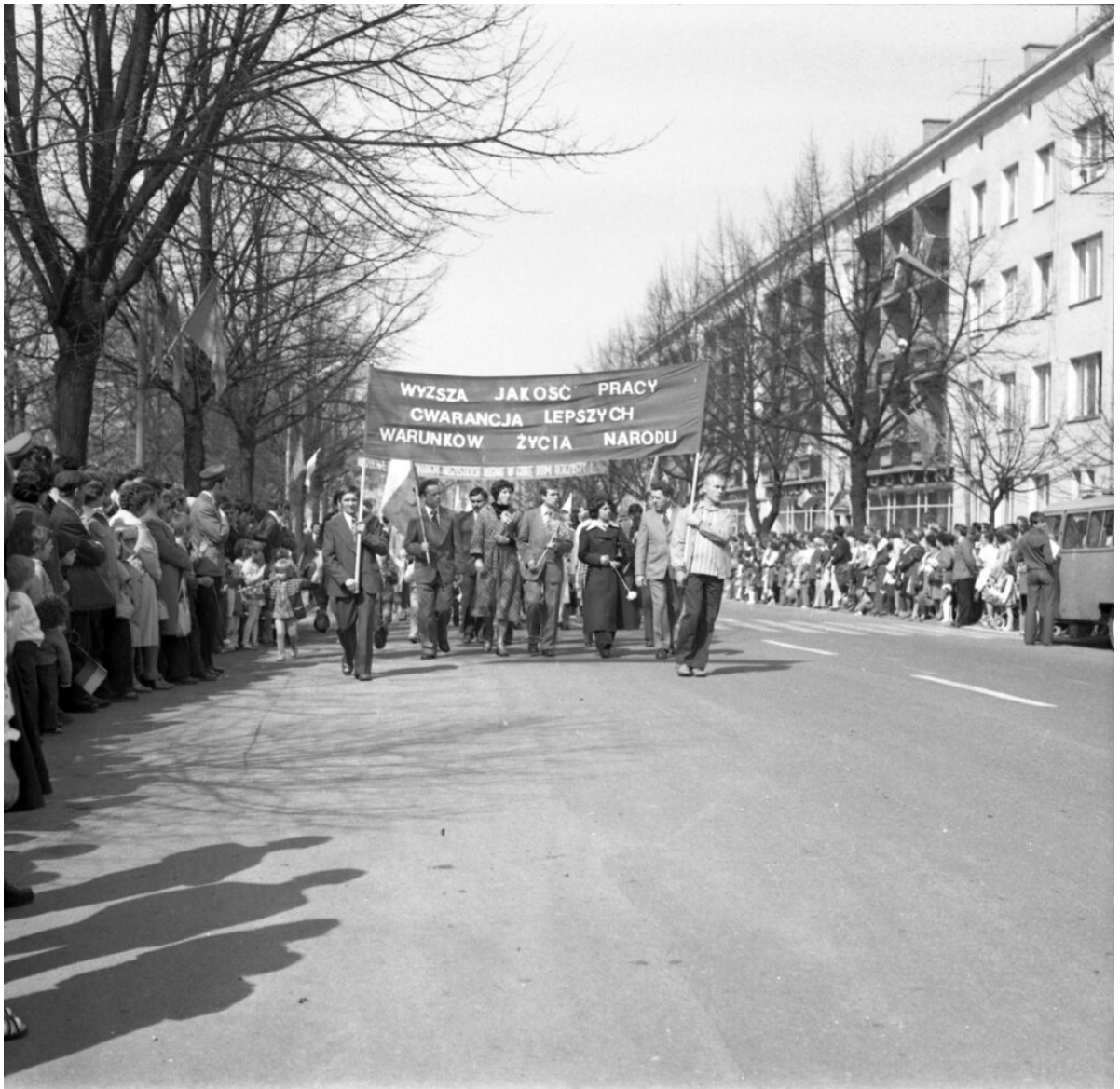
Uroczyste obchody Święta Pracy 1 maja 1977