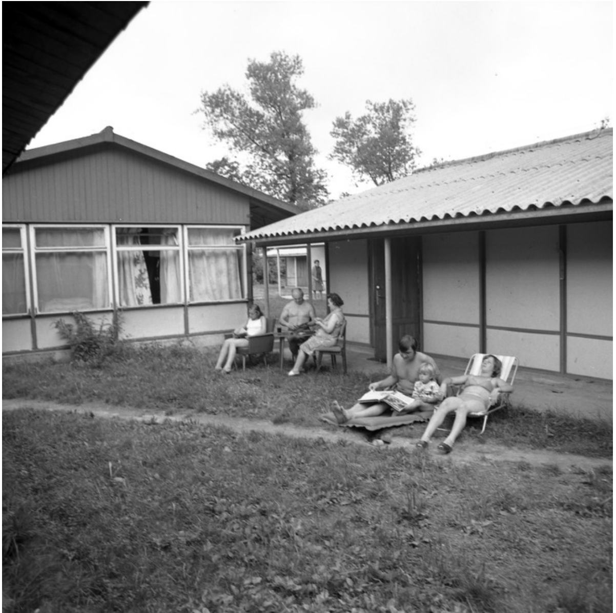
■ Ośrodek Wypoczynkowy Róża Wiatrów w Giżycku