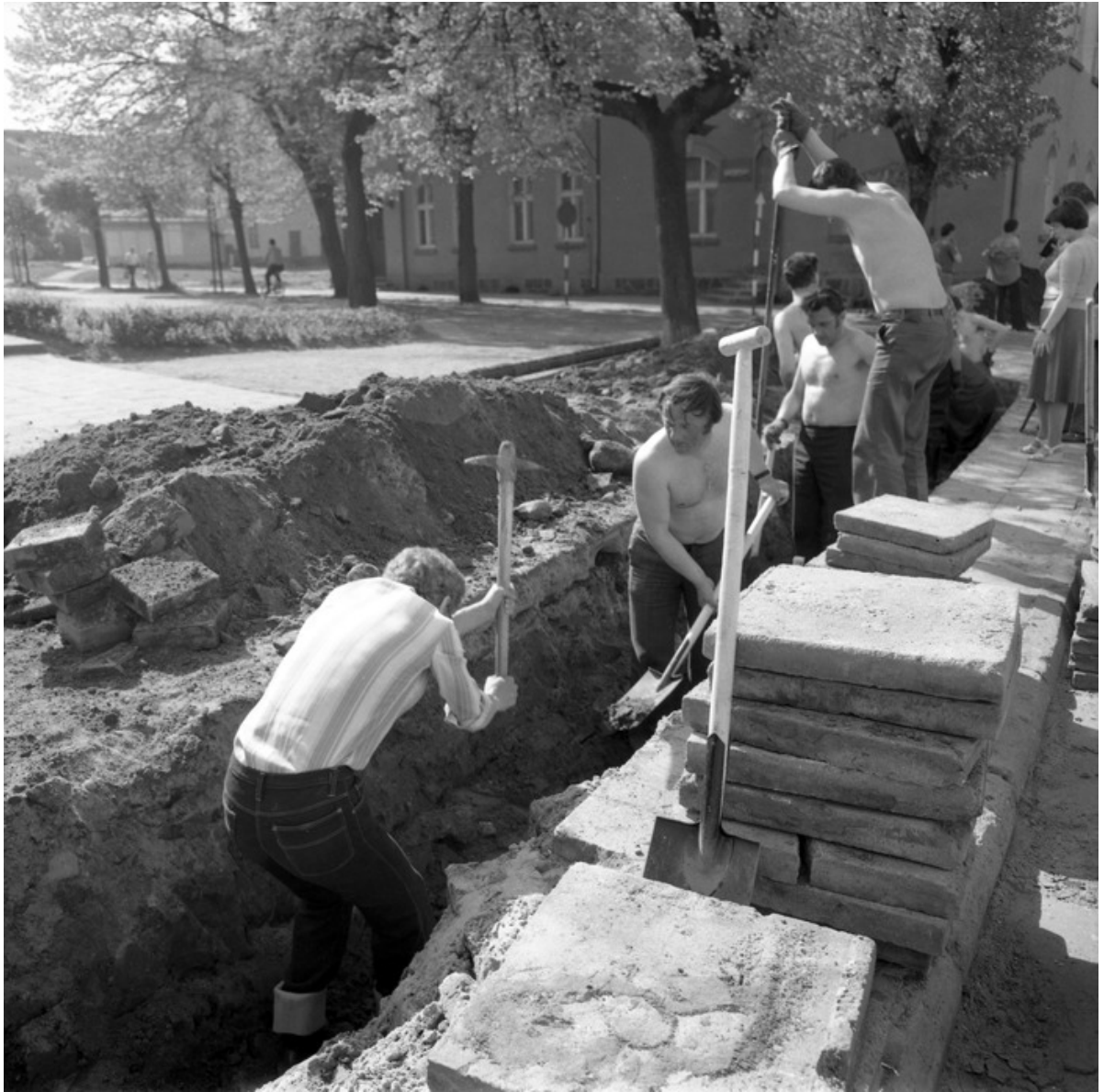
■ Czyn społeczny 1970