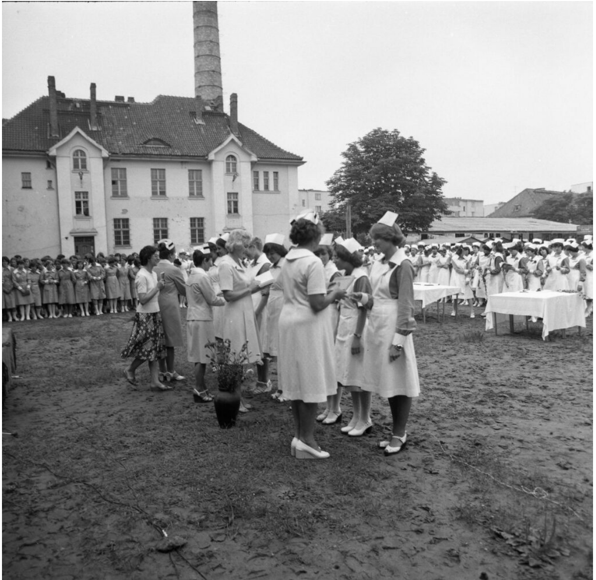
Czepkowanie w Liceum Medycznym 1977