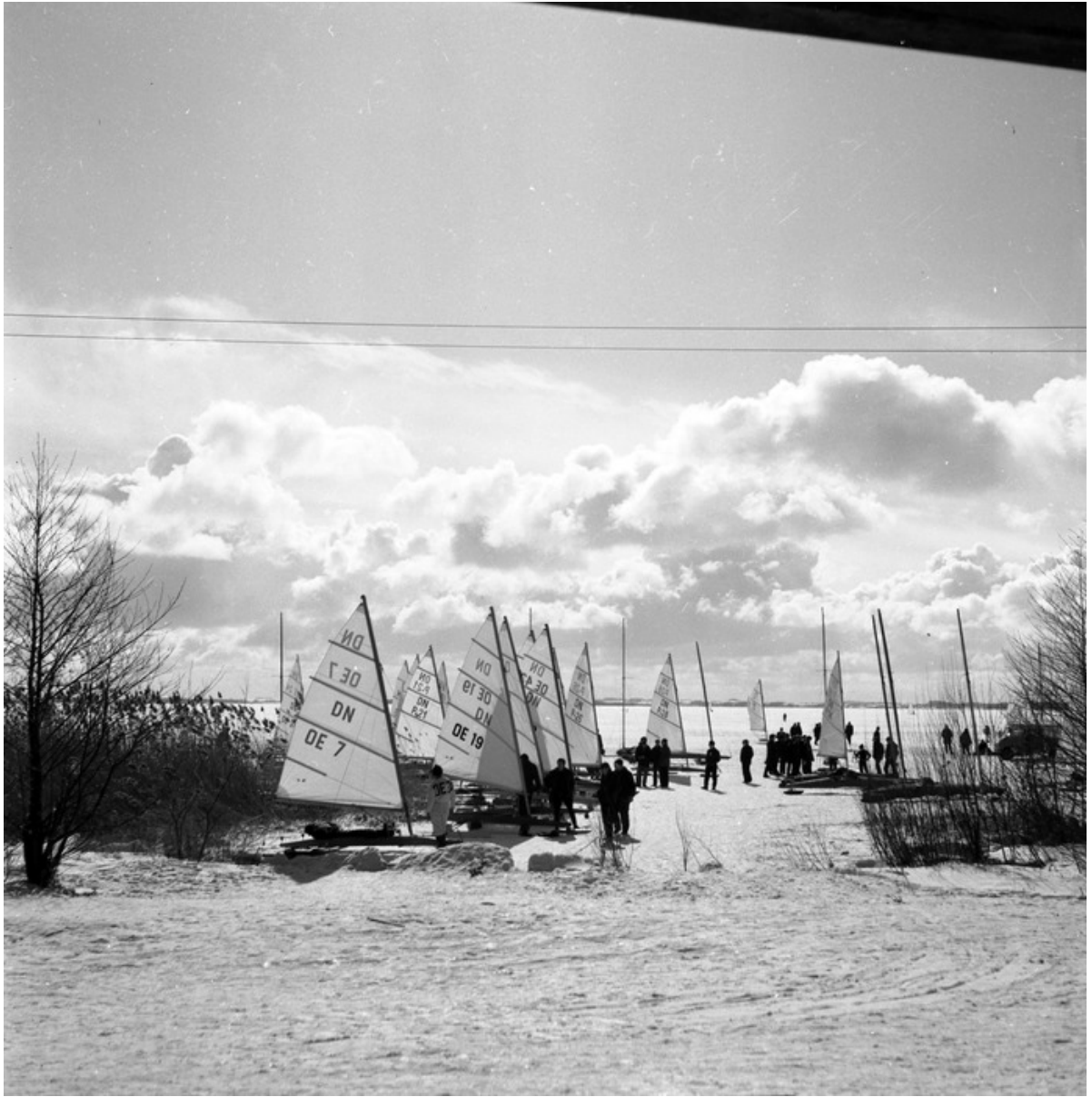
■ Zawody bojerów na jeziorze Niegocin 1970