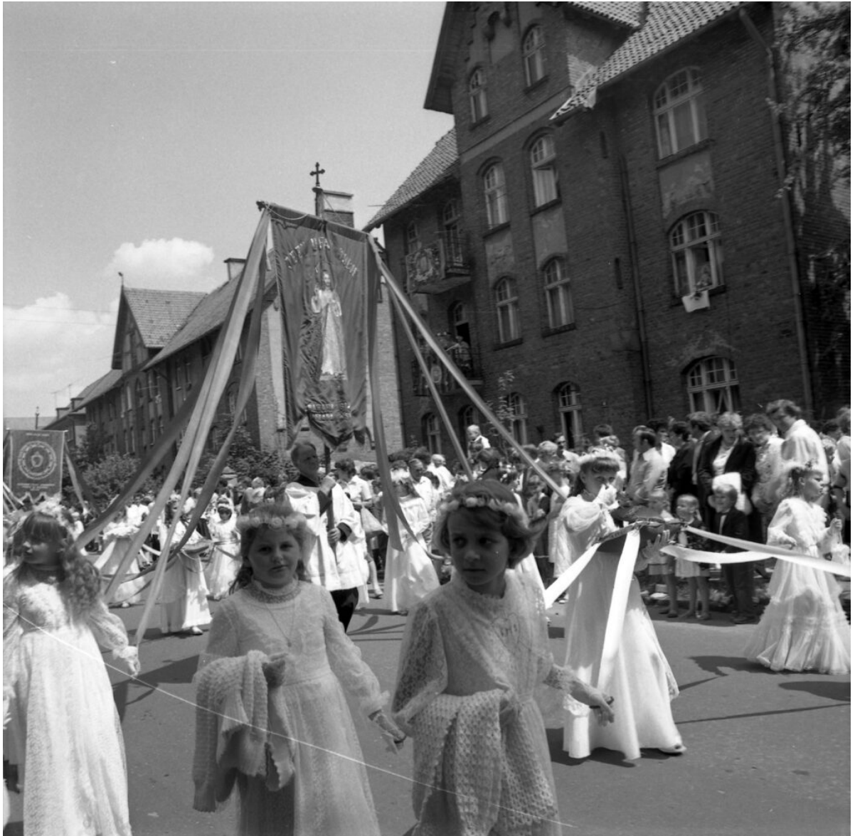
Procesja Bożego Ciała 1980