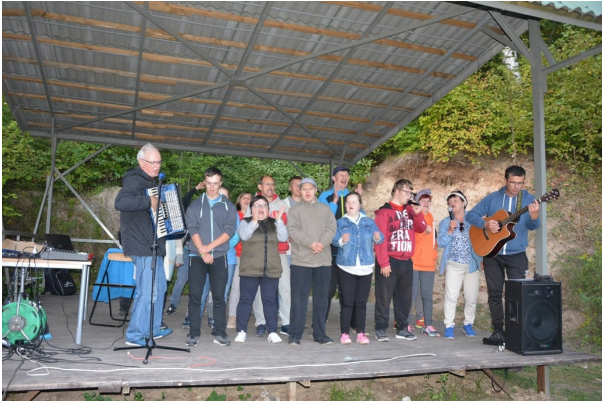
■ Śpiewanie szant przy gitarze