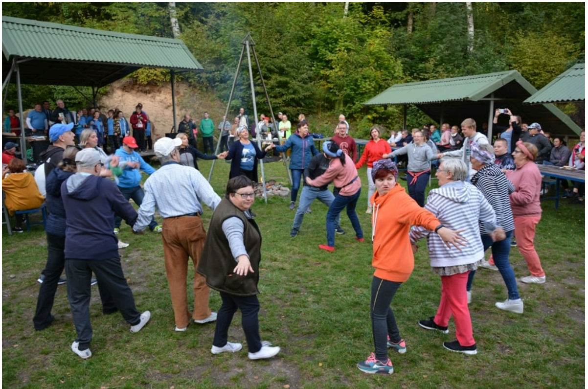
■ Wspólna zabawa