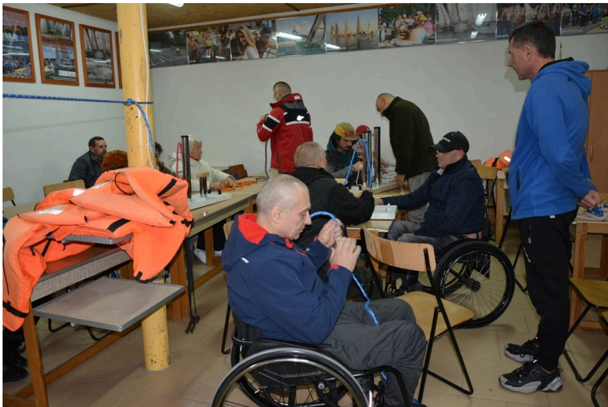
Nauka wiązania węzłów żeglarskich