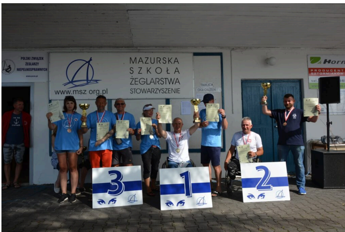
Nagrody po zakończonych regatach