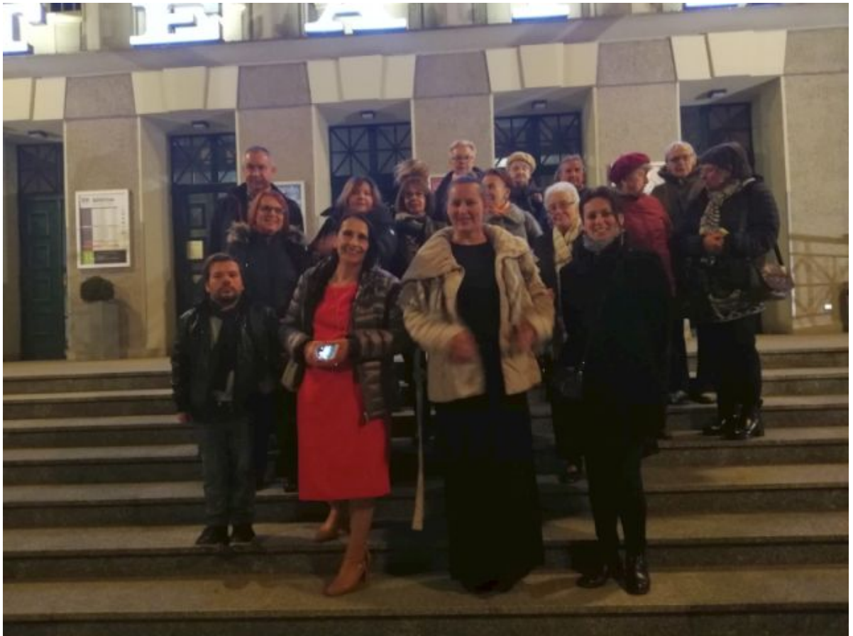
Teatr w Olsztynie