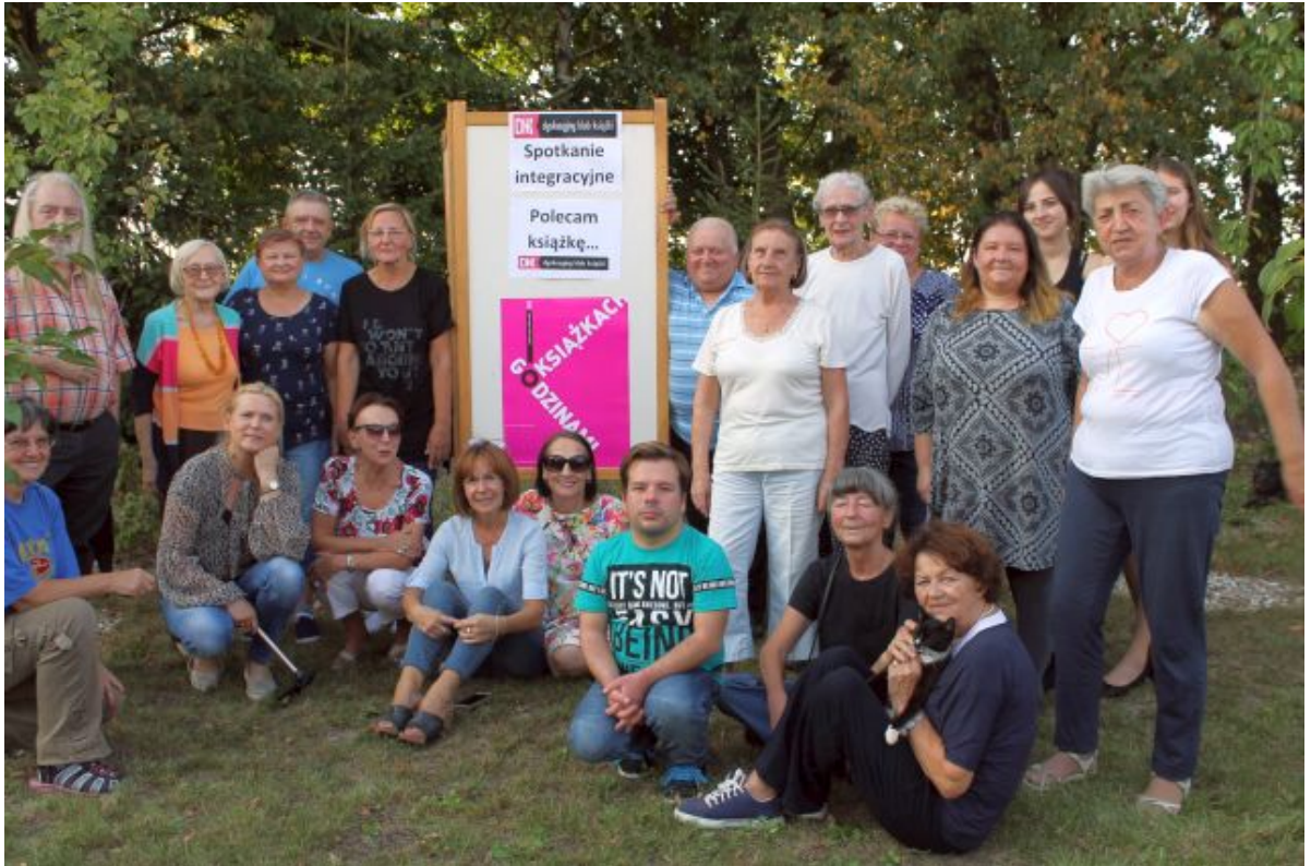
Spotkanie integracyjne z DKK Miłki